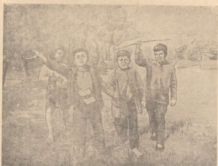
სტალინი - ბავშვითაჟის ტოლ-ამხანაგბითან მხატვარი ვოლგინი

მხატვართა გაღწერის დაბაზში შესვლისთანვე ყურადღებას იპყრობს ანხ. ანხ. სტალინის,