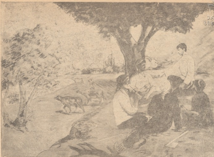
სტალინი გლეხებთან ქართლში