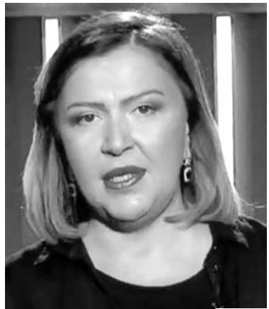
თამარ დვლიშვილის ორდენის კავალრები

არის აქ რამე მიუღებელი? როგორ, მოლაპარაკებს და მტერს საკადრის პასუხი არ უნდა გავცეთ? არაო, აათამაშა ინგა გრიგოლიამ მუსკულები ტატამზე გასული ძიუდოსიტებით, გაშალა მკლავეები სამკაღში გასული კომბაინის ტარაბუსავით. ენა? ოპ, ენა კი გადაიგდო მხარზე კავკასიური ნაგავივით. მისმა წვეტიანმა ხმამ გაჰკვეთა ატმოსფერო და ეკრანზე გამოჩნდა თეთრი ბოლი ზოლად: ხედავთ, ხალხო, რას აპირებს ირაკლი ღარიბაშვილი არჩევნების შემდეგო? ყველა უნდა დაგვიჭიროსო, გაგვაცემბიროსო, გადაგვასახლოსო, სიტყვის თავისუფლება შეგვიზღუდოსო, დემოკრატია ჩაახშოსო.