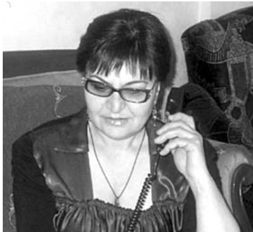
ოჯახის წერილობითი განცხადების საფუძველზე.

მთავარისა კავშირშილი. ტელ.: 593 78 64 69