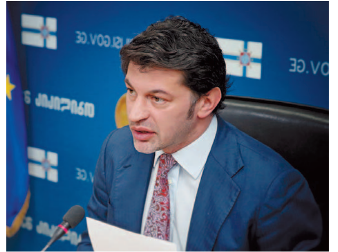
თხუთოვათი უშანსო „პატრიოტი“ ერთის წინააღმდეგ

არა, ნაცებს – არაკაცებს! ქვეყანა რომ სისხლით მორწყეს, ქვეყანა რომ ჯვარზე აცვეს. ერი ამით ავკაცობას, გაიხსენებს კიდევ ას წელს. არა, ქვეყნის გამყიდველებს, მტრის მოყვარეს, მოყვრის – გამცემს, შერცხვენა და თავზე ლაფი, ნაცის ქომაცს, ნაცის დამცველს, ნაცი-გნაცი საქართველოს ვერასოდეს დამარცხებს! არა, ნაცებს! არა, ნაცებს! არა, ნაცებს – არაკაცებს!