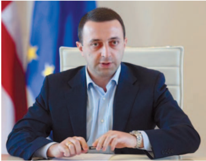
ირაკლი ღარიბაშვილის მთავარი კოზირი

ვანტანგ ხარჩილაძე: „ნაცმოძრაობა“ მტერია, რომელიც 2 ოქტომბერს კიდევ ერთხელ უნდა დავაგერსხმოდ - სხვა გზა, არ არის!