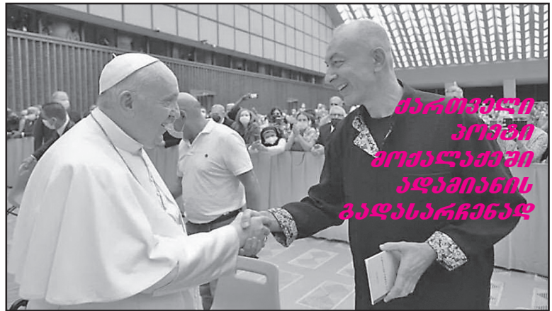
პაპი ფრანცისკანს მოქალაქე ადასარჩენად