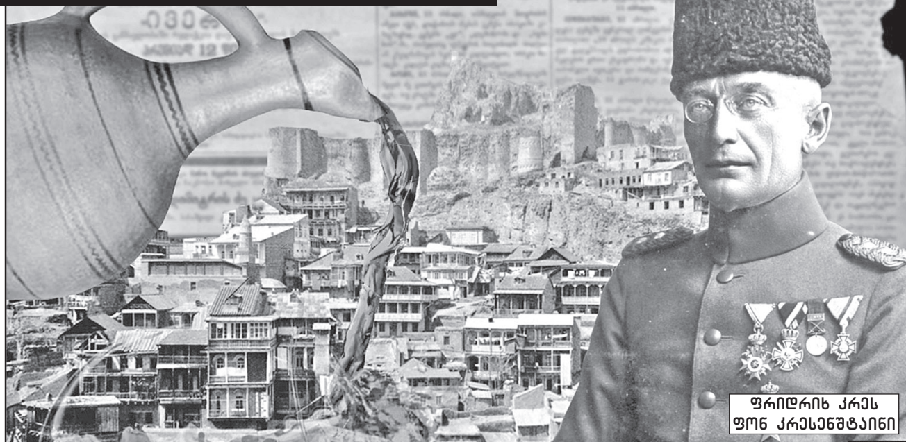
ფრიდრიხ კრავისტი ფონ კრავისტიანი