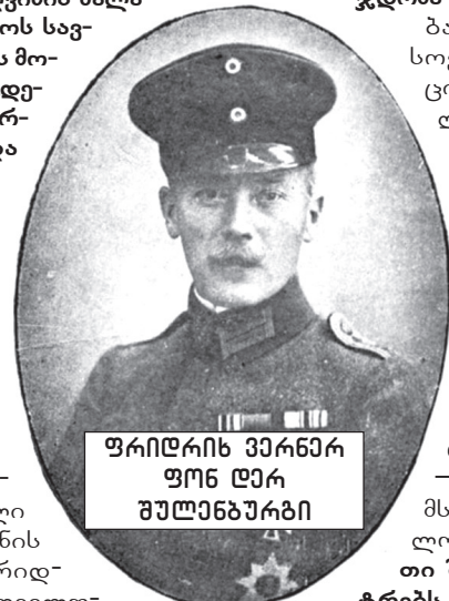
ფრიდრიხ ვირნერი ფონ ლარ შულენბურგი

ბარონ ვასილ გაბაშვილთან — 1916-1917 წლებში თბილისის სამხედრო კომენდანტთან და დამოუკიდებელი საქართველოს ახლად შექმნილი ქართული სამხედრო კორპუსის მეთაურთან, ლხინის სუფრა გაზიარებული აქვს ბარონ ფრიდრიხ კრეს ფონ კრესენსტაინსაც, საქართველოში გერმანიის სამხედრო-დიპლომატიური მისიის ხელმძღვანელს 1918 წელს. „რუსეთის არმიის ყოფილი გენერლის გაბაშვილის — ძალზე ავტორიტეტული, ღირსეული და განსაკუთრებული“