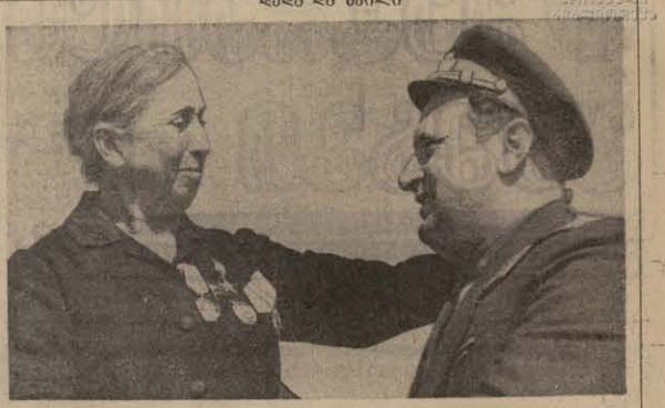
... მარტონი რამპონი ...