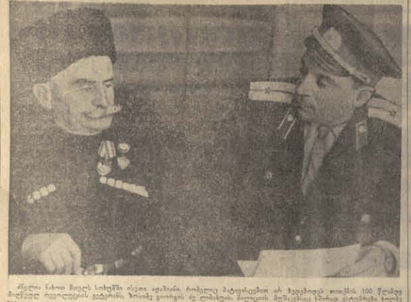
სახლი წინა მოვლ სისტემა გეგმადაა. ამოღებული კონსტრუქციები და მასალები მოქმედებს 100 წელზე მეტად ხარისხის აბაზანის, აბაზანის, აბაზანის და სხვადასხვა სახის სასაუნო და სასაბურთაო ნივთების წარმოებას.