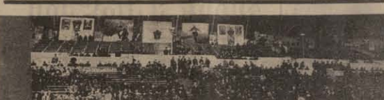
საკვრთა სხანდრო ღაცვის 50 წლისთავისთვის