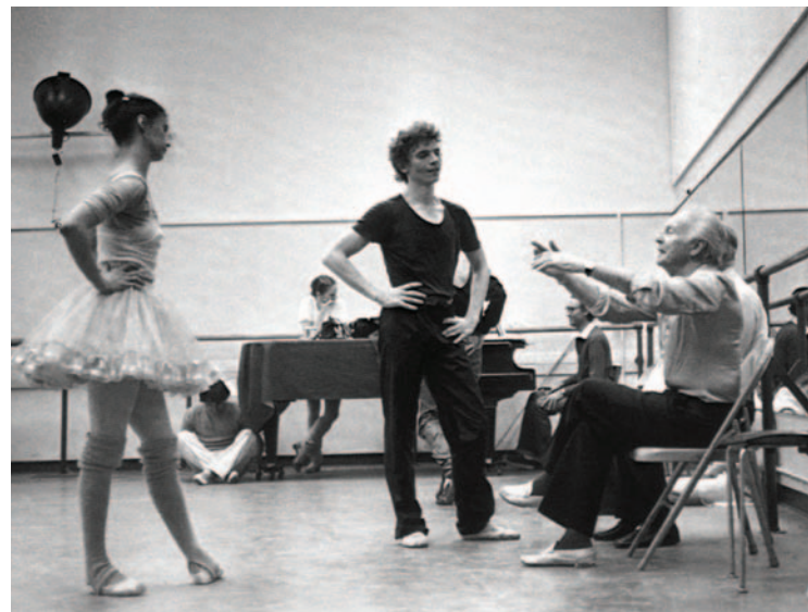
ჯორჯ ბალანჩინი რეპეტიციებზე სიუზან ფარელთან და იბ ანდერსენთან ერთად GEORGE BALANCHINE IN REHEARSAL WITH SUZANNE FARRELL AND IB ANDERSEN