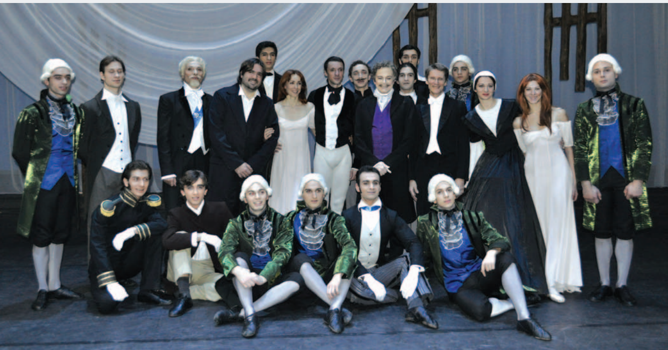
სილვია გილემი და მასიმო მურუ (ცენტრში) საქართვლოს სახელმწიფო ბალეტის მსახიობებთან ერთად სპექტაკლის შემდეგ SYLVIE GUILLEM AND MASSIMO MURRU (CENTRE) WITH ARTISTS OF THE STATE BALLET OF GEORGIA AFTER A PERFORMANCE