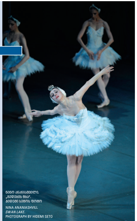
ნინო ანანიაშვილი. „გედების ტბა“. NINA ANANIASHVILI. SWAN LAKE.

Ananiashvili celebrated her 30th anniversary on stage this year. She admirably danced the different characters of Odette (White Swan) and Odile (Black Swan), with polished acting talent and elegant movements and received a standing ovation for more than 10 minutes at curtain call.