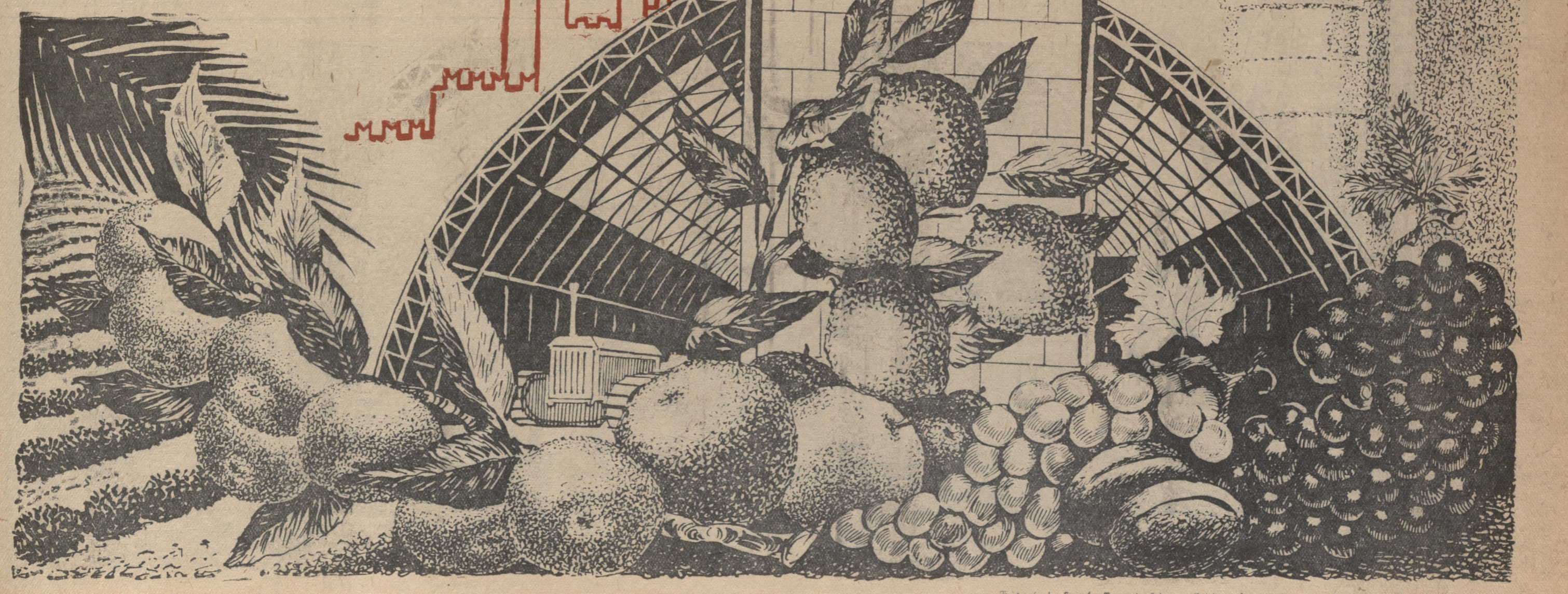
მხატვარი ს. ნადარევილის ნახატი, შესრულებული სპეციალურად გ. მ. კომუნისტისათვის.

საქართველოს სტატისტიკური ცენტრის მიერანს უმ. ჩარკვიანს საქართველოს სსრ სხედრო კომისარია საბჭოს თავმჯდომარე უმ. ბაქრაძეს