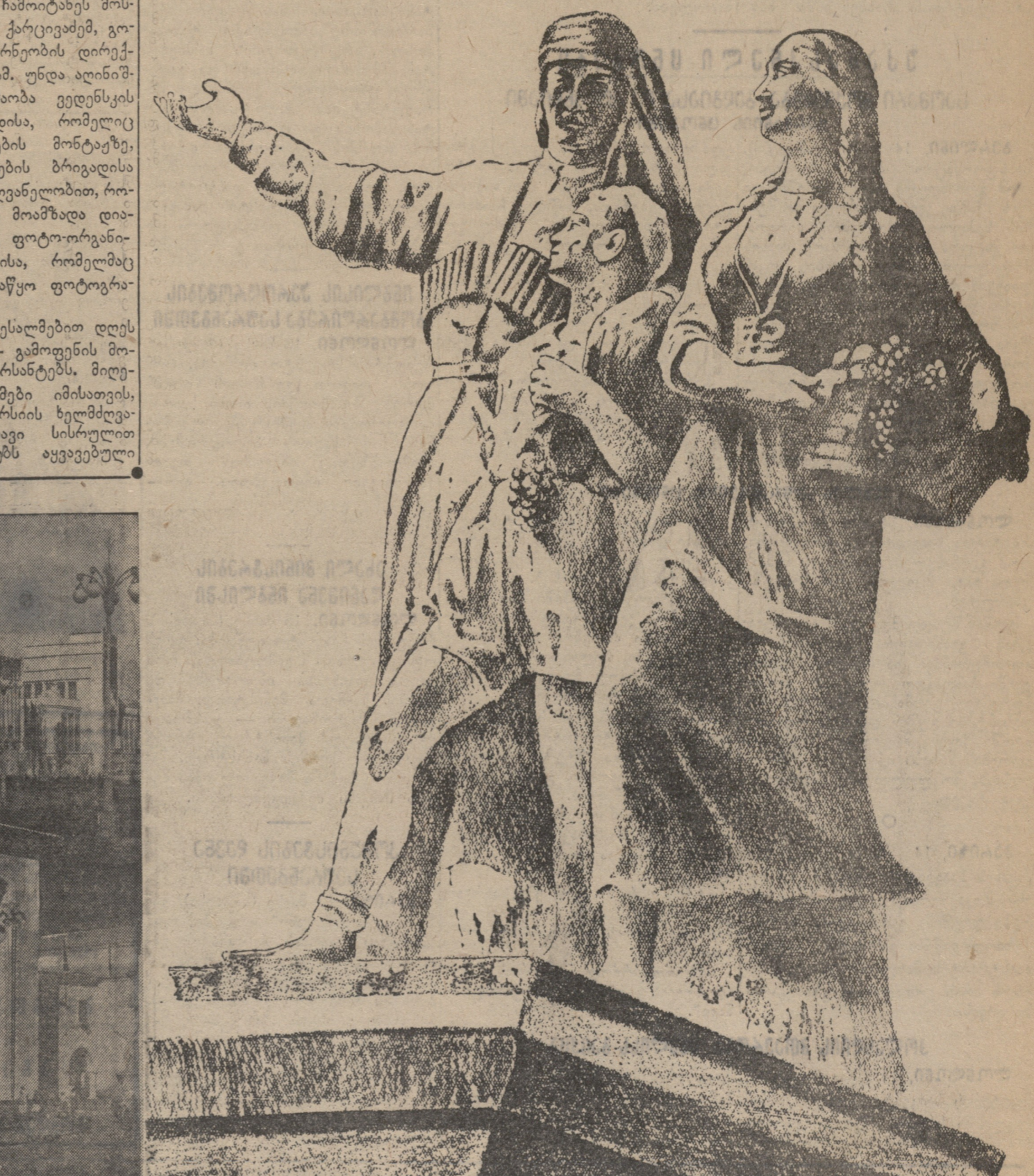
სსრკ-საქართველოს სასოფლო-სამეურნეო განვითარებაზე მილიონ საქართველოს რესპუბლიკის პავლიონი ისევე, როგორც მარაში, შეფასებით „ფრიადზე“ დასრულდა.