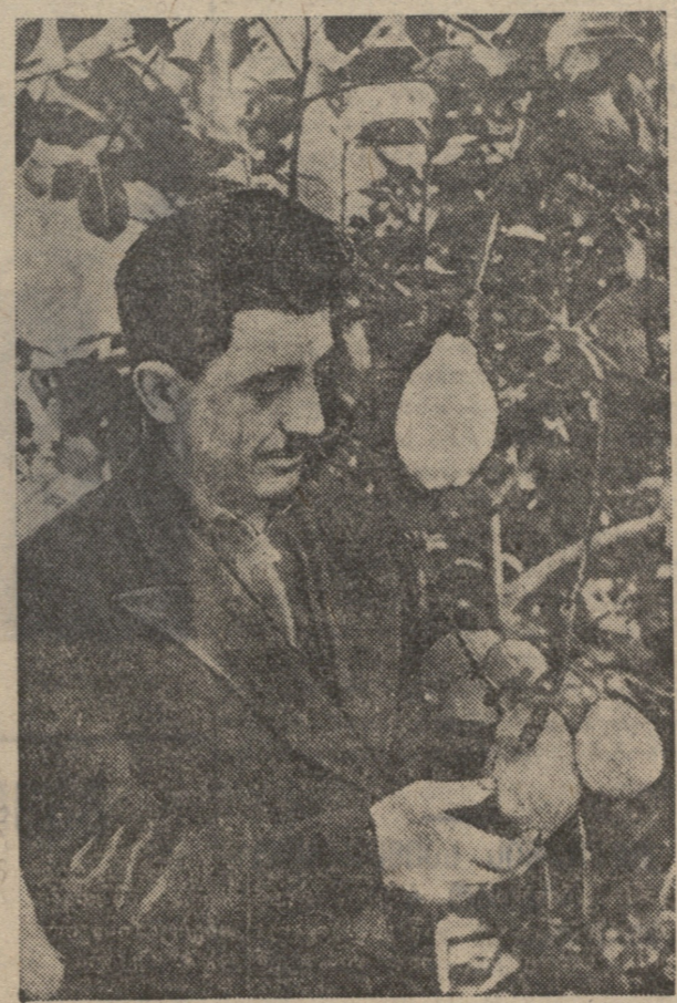
სსრკ-საქართველოს სასოფლო-სამეურნეო განვითარებაზე მილიონ საქართველოს რესპუბლიკის პავლიონი ისევე, როგორც მარაში, შეფასებით „ფრიადზე“ დასრულდა.

ლეს ისხნება 1940 წლის სსრკ-საქართველოს სასოფლო-სამეურნეო განვითარებაზე მილიონ საქართველოს რესპუბლიკის პავლიონი ისევე, როგორც მარაში, შეფასებით „ფრიადზე“ დასრულდა.