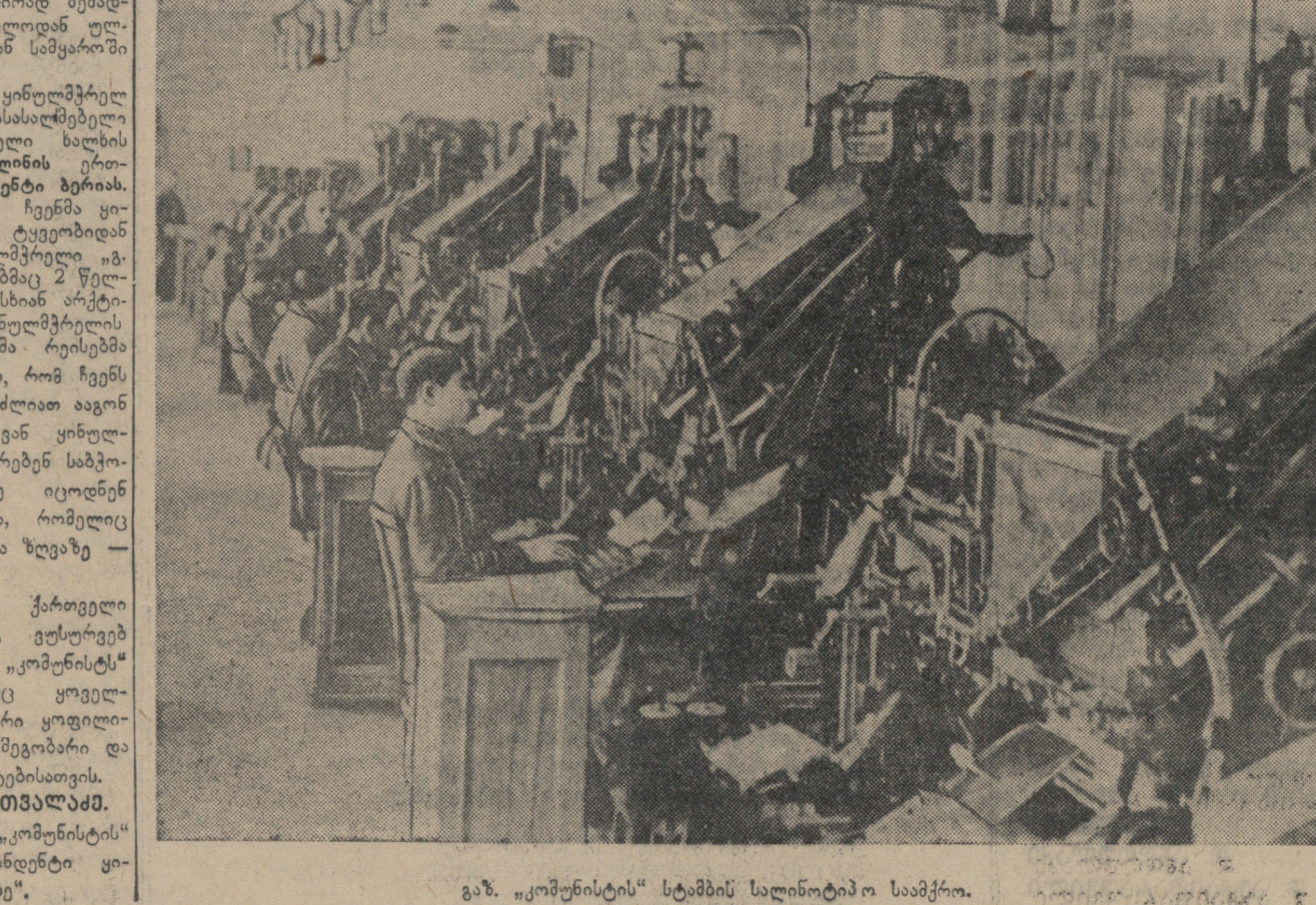
გან. „კომუნისტის“ სტამბის სალინიტიპო საბჭო.