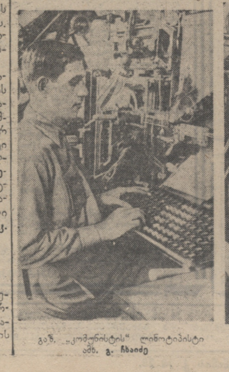
ვაზი „კომუნისტი“... მთელი სიყვარული...