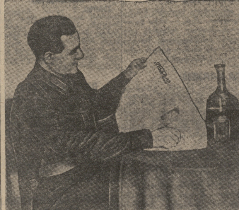
საქართველოს ბოლშევიკთა... მთელი სიყვარული...