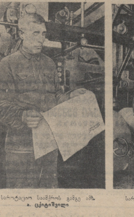
საბრძოლო საბრძოლო... მთელი სიყვარული...