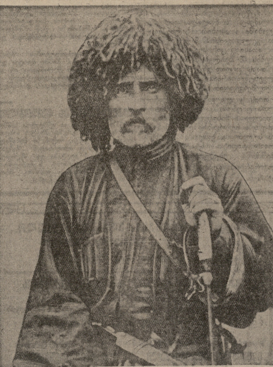
გაყა-ფშავი უკანასკნელ წლებში.

გაყა ლიქოკალი სოფ. ბარისბო (ხეველეთი), დუშეთის რაიონი.