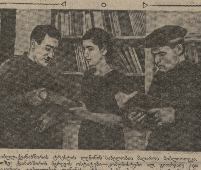
ტყელების-ქანაშხლის ტრესტის ლენინის სახელობის მაღაროს ბიბლიოთეკა. სურათზე: ქანაშხლის ტრესტის ლენინის სახელობის ბიბლიოთეკა. აღ. გომიანიძე და დ. კვიციანიძე.

საქართველოს პ. პ. (ბ) ცენტრალური კომიტეტის... (ს. ჯანაშია)