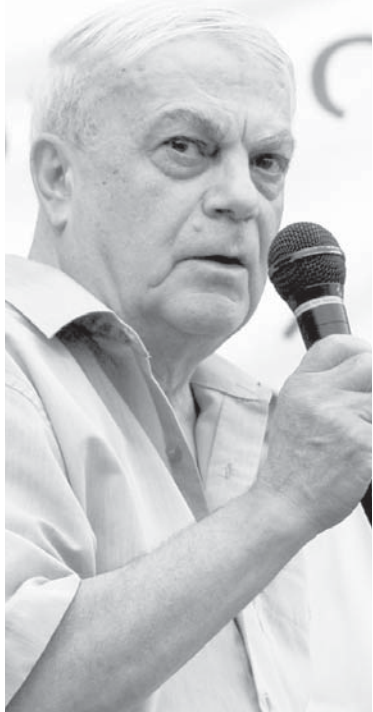
გვესაუბრება მწერალი, აკადემიკოსი ელიზბარ ჯაფარიძე

ფურთხის ღირსია საქართველოს ის ნაწილი, რომელიც „ნაცმოძრაობას“ უჭერს მხარს