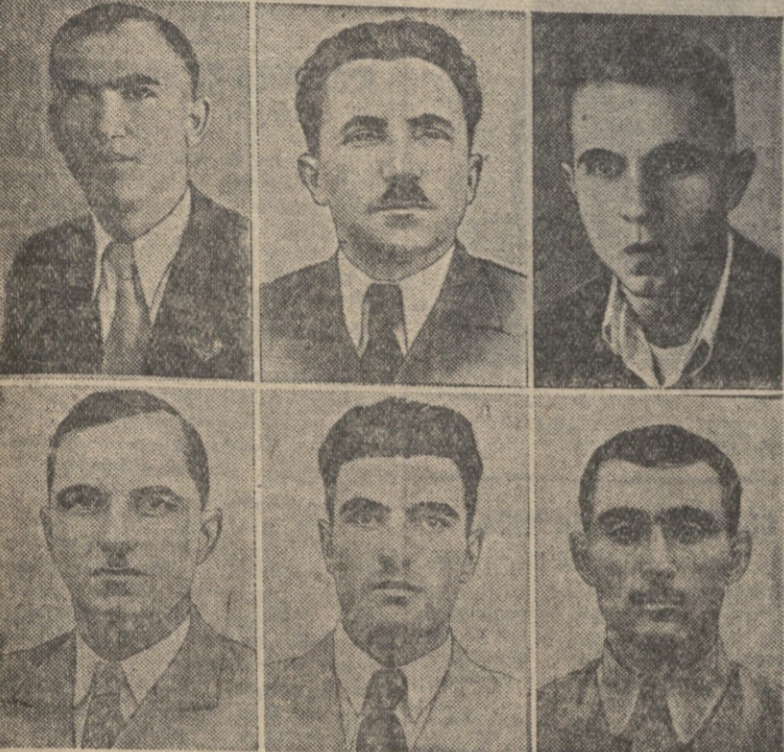
საქართველოს ენერჯეტიკის მოწოდებენ... მარცხნიდან მარჯვნივ პირველი რ. გეგმა...