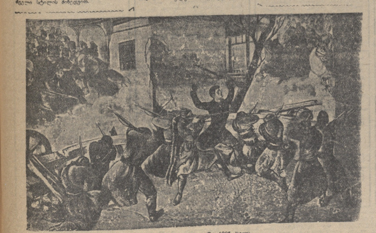
ბარაკები ქ. თბილისში 1905 წელს. შტაბ. ლ. გუდავილის ნახატი.

დაფიცვის დღეები. აქედან გამომდინარე, რევოლუციური მასის პირველი ძლიერი შეტევის მთავალი მოსკოვის პროლეტარიატის გმირული გამოსვლა იყო. «მოსკოვის შვიარაღუნული აჯანყება» გახდა ბოძისათვის, რომ კავსიის რევოლუციურ მასებს დაეწყათ პირდაპირი თავდასხმა თვითმპყრობლობაზე» (ლ. ბერი, «ამიერკავსიის ბოლშევიკური ორგანიზაციების ისტორიის საკითხისათვის», გვ. 86).