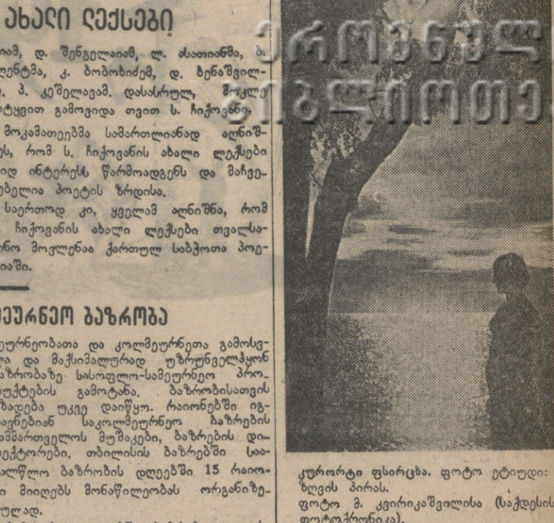
კურთხევის დღისათვის, ფოტო რედაქციის მიერ...