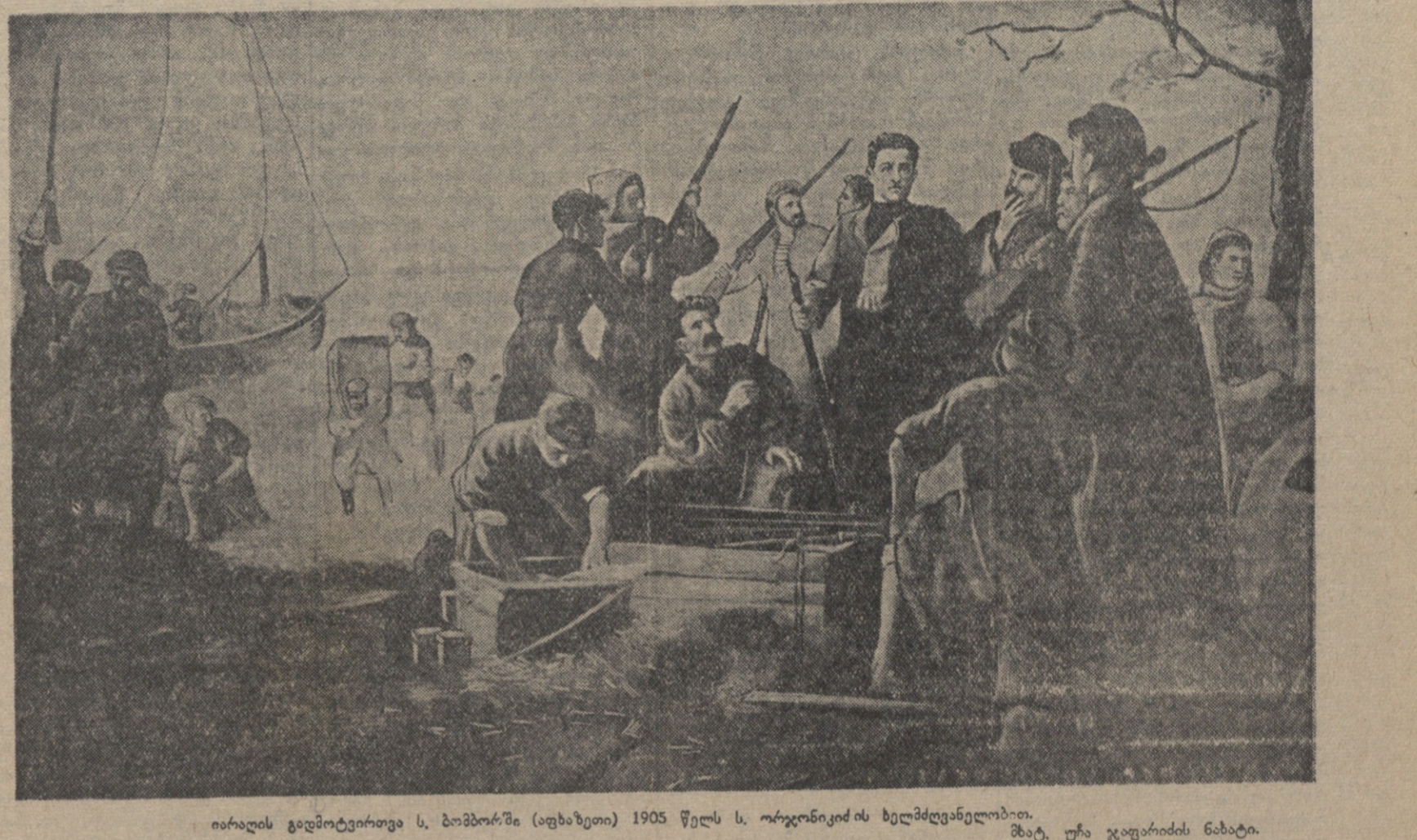
იარაღის განადგურების დღე, ბოშების (უხანავთი) 1905 წელს ს. ორგანიზაციის ხელმძღვანელობით.

ნაიალდების განადგურების შემდეგ რევოლუციის ძალიან თავისუფალი და დიდებული, მებრძოლი, დრეტიანი ემზადებდა შეტაკებისათვის. 23 დეკემბერს მთავრობის ჯარმა იერიში მიიტანა დიდუბეზე, პირველად ალყა შემოარტყა ვიდუბურის სახლს, სადაც მოთავსებული იყო ბოშების საზოგადოება. აქ იმყოფებოდა რევოლუციონერთა სამხედრო შტაბი. როგორც კი მთავრობის ჯარი მოეახლოვდა ვიდუბურის სახლს, მისი სარდალად მებრძოლი დროინამ ჯარს სწავლიდა ატეხა. ამის მიყვანა ვიდუბურის სახლიდან მებრძოლი დრეტიანის რაზმი გამოდგინდა. აჯანყებულებს შტაბის ისეთი მძაფრი ხასიათი მიიღო, რომ პირველ ხანებში მთავრობის