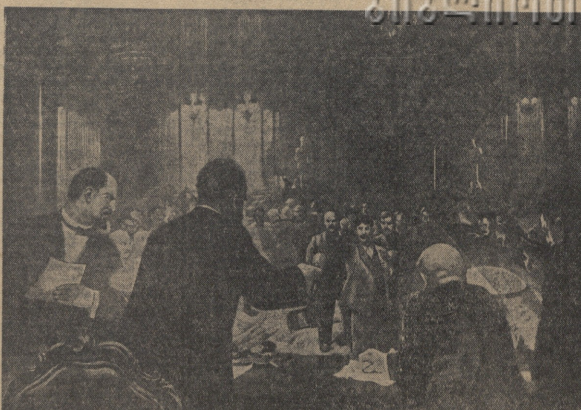
თბილისის სკალინის მემორუალის თეზისის გეგმისათვის...