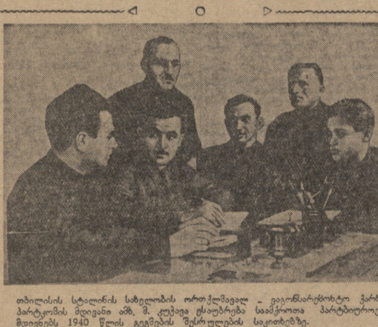
თბილისის სკალინის მემორუალის თეზისის გეგმისათვის...