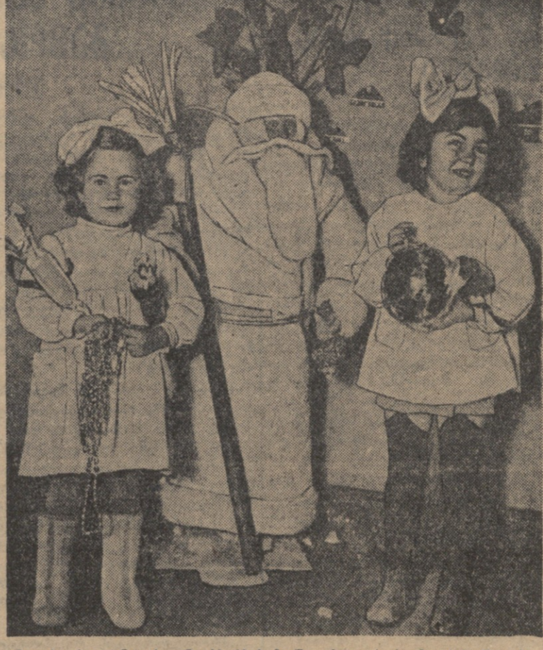
თბილისი, სტალინის რაიონი № 69 საბავშვო ბაღი. სურათზე: საბავშვო ბაღის ბავშვები საბავშვო სასაფლაოში.