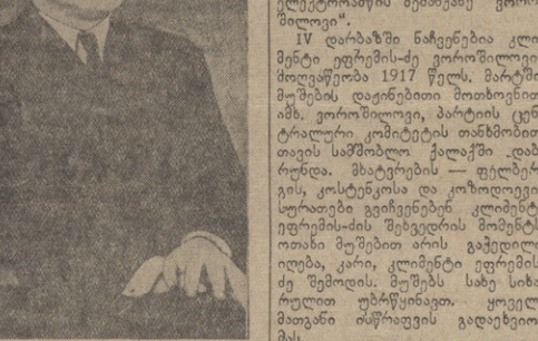
ა. ნ. კრავაძისტიკი