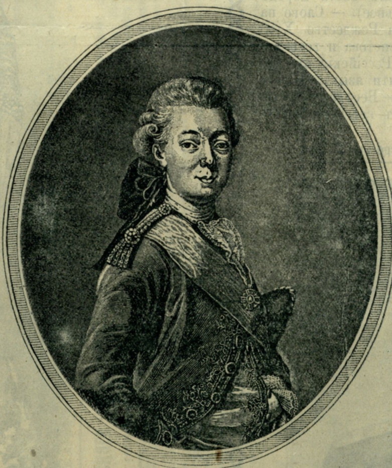
Императоръ Павелъ I-й.

съ множествомъ иллюстрацій и портретовъ.