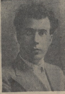
ა.ს. დვალა, აფხაზეთის ასსრ უმაღლესი საბჭოს პრეზიდიუმის თავმჯდომარე