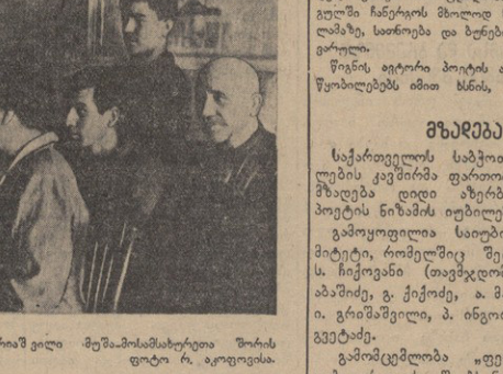
თბილისის კომუნისტური ორგანიზაციის...