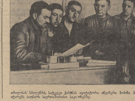
თბილისის კომუნისტური ორგანიზაციის...