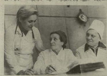
ამ ადგილზე... პირობები...