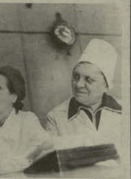
გენერალ-მაიორი გ. მ. მუხომოვი

წარმოადგენს დამოუკიდებელ კორპორაციას, რომელიც მოქმედებს ჩრდილოეთის რეგიონში 1951 წლის 22 დეკემბრის კანონით დადგენილი წესით.