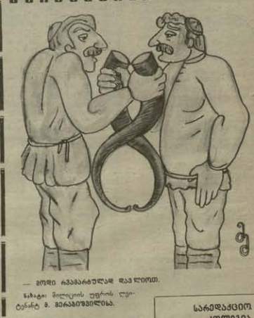
— ერთი ანგარიშითაა დასრულით.