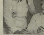
გენერალ-მაიორი გ. მ. მუხომოვი

დამდგომარეობის ასეა ჩაირიკინა, რომელიც მოქმედებს ჩრდილოეთის რეგიონში 1951 წლის 22 დეკემბრის კანონით დადგენილი წესით.