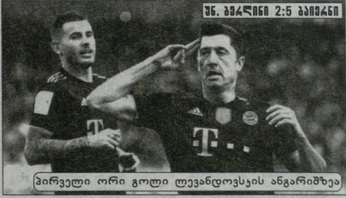
შ. ბარლინი 2:5 ბაიერნი

ბაიერნმა თასზე დამარჯვების შედეგად ბარლინში ხუთი გოლი გაიტანა