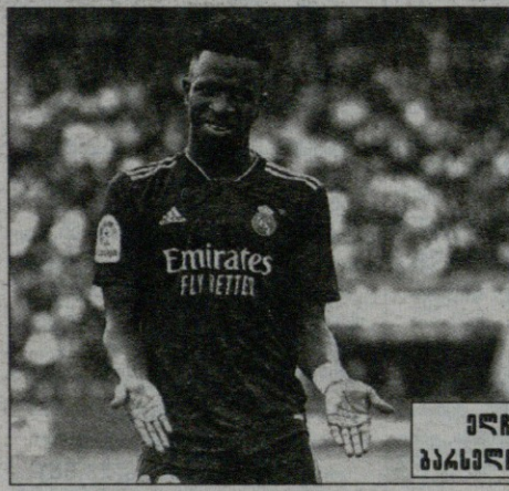
ვინი 1:2 ლალი ბარსელონა 1:1 ალავესი

„როსონერიმ“ სერია A-ში მიჯრით მე-7 გამარჯვება იზეიმა