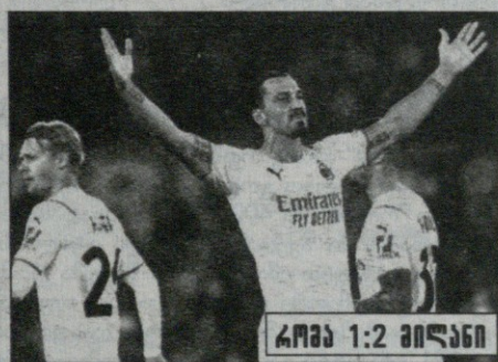
რომა 1:2 მილანი ზლატანს ეროვნულ ჩემპიონატებში 400 გოლი დაუგროვდა

ბარი ნავილი: ტოტენჰემთან მატჩი რონალდუმ მოიგო