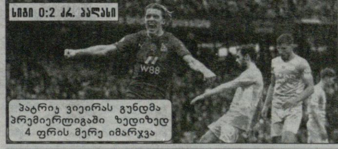
სიტი 0:2 ქ. პალასი

სიტი საკუთარ მოედანზე ქრისტალ პალასთან შარცხვა