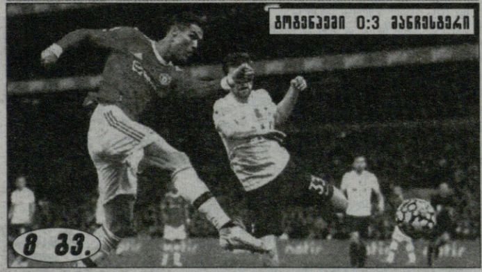
ტოტენჰემი 0:3 მანჩესტერი

ბარი ნავილი: ტოტენჰემთან მატჩი რონალდუმ მოიგო