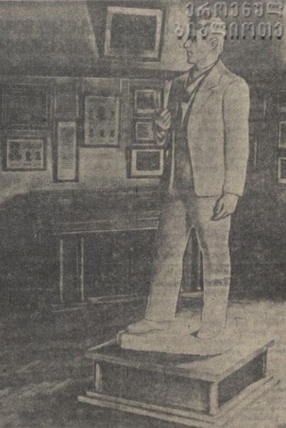
გამომცემი თბილისის სტალინი 1-ლი მოქმედების სეცია.