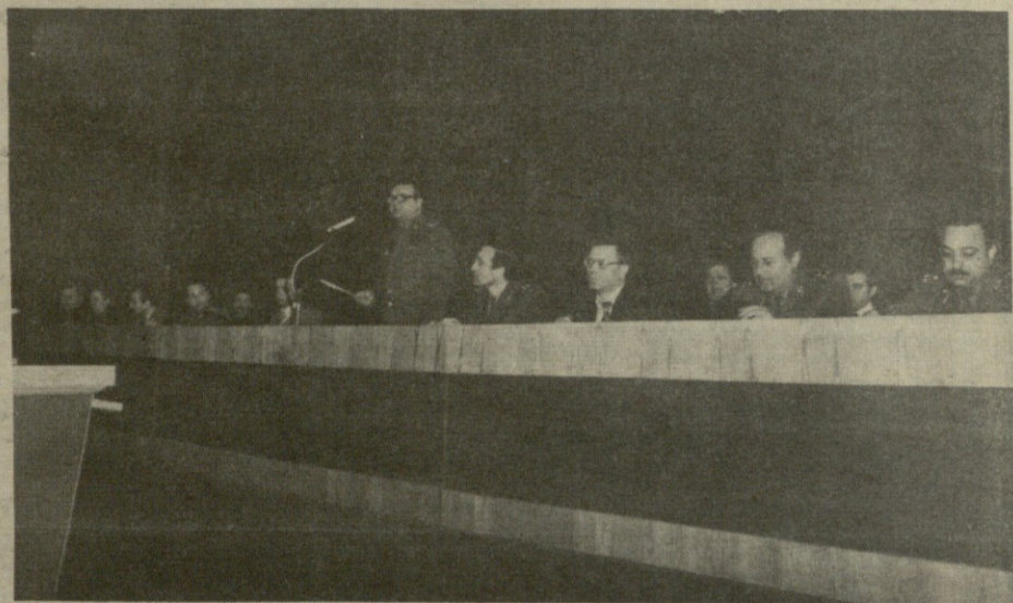
НА СНИМКАХ: участники семинара-совещания направляются к памятнику В. И. Ленина; открытие семинара-совещания.