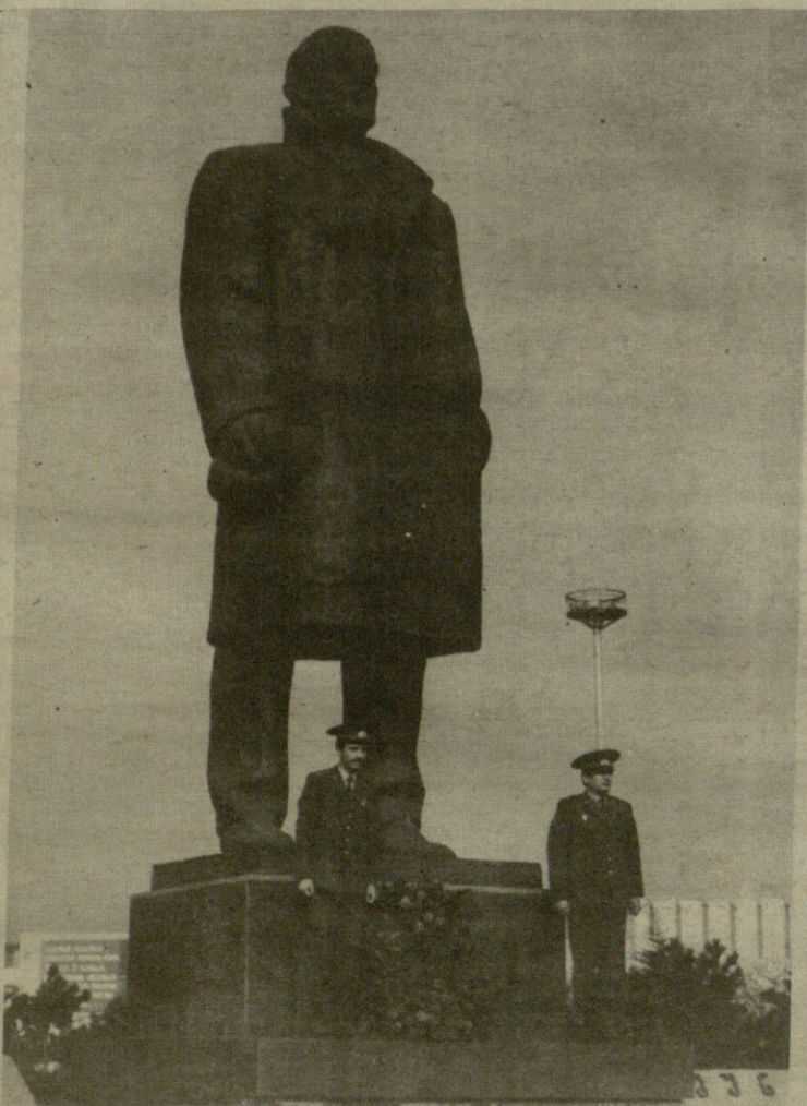
УЧАСТНИКИ СЕМИНАРА-СОВЕЩАНИЯ ВОЗЛОЖИЛИ ВЕНКИ К ПАМЯТНИКУ В. И. ЛЕНИНА.

28 МАРТА В КОМСОМОЛЬСКОМ ГОРОДКЕ БОРИС ДЗНЕЛАДЗЕ НАЧАЛ РАБОТУ ЗОНАЛЬНЫЙ СЕМИНАР-СОВЕЩАНИЕ ПОМОЩНИКОВ НАЧАЛЬНИКОВ ПОЛИТИЧЕСКИХ ОТДЕЛОВ ПО КОМСОМОЛЬСКОЙ РАБОТЕ, СЕКРЕТАРЕЙ ПЕРВИЧНЫХ КОМСОМОЛЬСКИХ ОРГАНИЗАЦИЙ ОРГАНОВ И ПОДРАЗДЕЛЕНИИ ВНУТРЕННИХ ДЕЛ АЗЕРБАЙДЖАНСКОЙ, АРМЯНСКОЙ И ГРУЗИНСКОЙ ССР.