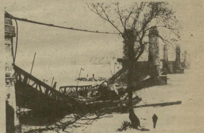
Мост через Лауру длиной 413 метров не выдержал непривычных для Франции морозов и рухнул. К счастью, все обошлось без жертв.

Около пяти лет работали над созданием этого робота (на снимке из газеты «Асахи») ученые из научно-исследовательского института при машиностроительном институте «Мицубиси дзюкогэ». Его назначение — заменить человека на особо опасных участках работы. Небольшой по своим размерам и обладающий хорошей подвижностью, этот робот может работать длительное время в тесном помещении атомного реактора и выполнять различные операции в соответствии с командами человека. Он может без труда преодолевать лестничные подъемы, переступать через трубы и другие препятствия, двигаться по узким проходам. Его глаза — кинокамеры — запечатлевают для ученых необходимую видеoinформацию.