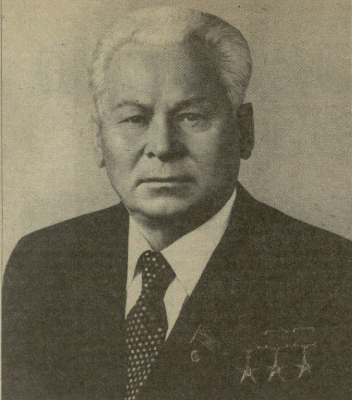
კ. უ. ჩერენკოს დაკრძალვა

საბჭოთა ხალხი, მთელი პროგრესული კაცობრიობა 13 მარტს გამოთხოვენ კონსტანტინე უსტინის ძე ჩერნენკოს — კომუნისტური პარტიისა და საბჭოთა სახელმწიფოს, საერთაშორისო კომუნისტური და მუშათა მოძრაობის გამოჩენილი მოღვაწის, სკკ ცენტრალური კომიტეტის გენერალური მდივანს, სსრ კავშირის უმაღლესი საბჭოს პრეზიდიუმის თავმჯდომარეს.