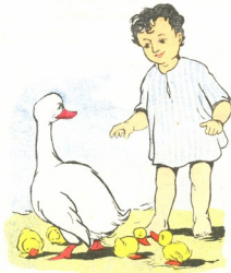
ნახატები ა. კანდელაკისა

მწვანე მოლხე დაბავბავჯებს გურამიკო ტიტლიკანს. აგერ ბატმა რა ღამასი ჭუჭულები მოიუვანა! რა ფაფუკი, რა ვეითელი, რა ქორფა ჭუჭულებია, ერთმანეთს არ შორღეიან, წუნარად უჭუჭუკებიათ. გურამიკოს გული წუდებ ჭუჭულებს რომ ვერ აიუვანს; ამბობს: „ბატი ცუდი არის, ჭუჭულები ძლიერ მიუვარს!“