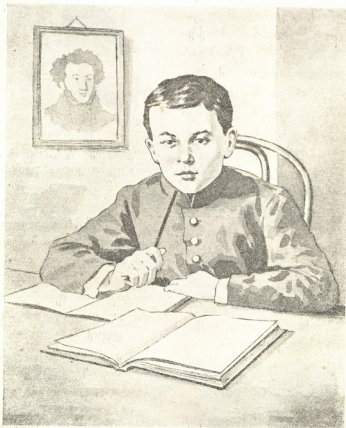
ვ. ი. ღვინი მონათულობის წლებში