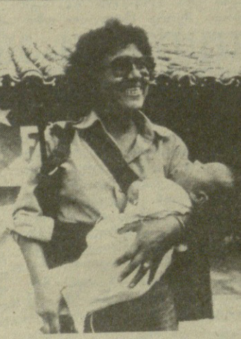
НА СНИМКАХ: партизанская мать; жертвы сальвадорского режима. ФОТОХРОНИКА ТАСС.

В борьбу против проамериканской диктатуры вовлекаются самые широкие слои населения.