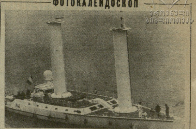
FRANCIJA. Известный французский океанолог Жак-Ив Кусто отправился в очередное морское путешествие. Его новое 30-метровое цельноалюминиевое судно «Алкион» отшло от причала французского порта Ла-Рошель.

მილიციის პოლიციელები ჯემალ რაფა ხაუდგა, მისი ყურადღება დაუქსაღიყიდა ახალგადა მუშაკ მლიციის საშუალო სასწავლებელში მიუვლინებიათ ამ სკოლა წარმონეით დამთავრების შემდეგ უზნის ინსპექტორის პა-უხსაგე-ე პოლიტი ჩაუბაოებიათ.