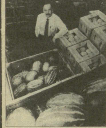
მოწამვლის მიზეზია შხამიანი პრეპარატი, რომლითაც ოთხი წლის წინ დაშუქდა კერძის (კალიფორნიის შტატი) ირგვლივ მყოფი პლანტაციები, სადაც მანამ ბამბა მოყავდათ. „იუნონ კარბაიდს“ სარეკლამო პროსპექტები ირწმუნებოდა, რომ ეს პესტიციდი ნივთიერება და მისი შემადგენელი ნივთიერებები და მოწამვლის სახიფათო ადამიანების ჯანმრთელობისათვის.

ამერიკის ქიმიურ კორპორაცია „იუნონ კარბაიდს“. ბრალი მიუძღვის მოქალაქეთა მასობრივ მოწამვლაში, რომელიც ამ ბოლო დროს რეგისტრირებულია აშშ-სა და კანადის ბევრ რაიონში. სულ ცოტა 200 კაცი მოიწამლა სახანძროთი, რომელიც მოყვანილია კალიფორნიის პლანტაციებში და მოწამული იყო ამ კამპანიის შხამქიმიკატებით. დაზარალებულთა რაოდენობა სულ უფრო იზრდება.