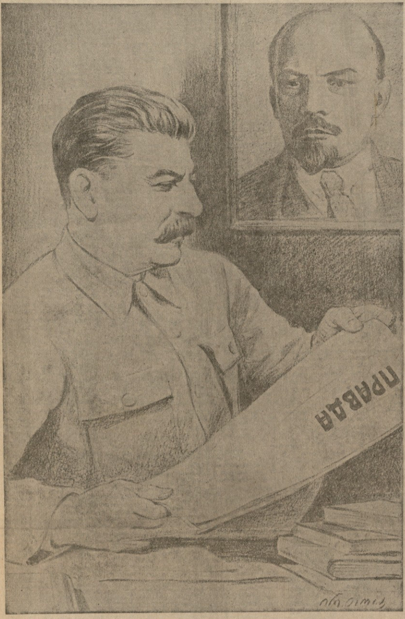
ბოლშევიკური ბაჭლითი სიყვილი და