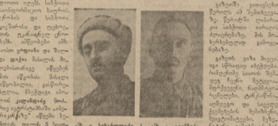
ა. ვ. სხარაშვილი

მეტი სიმბოლოა და დიდი იქნება ფორმა, რა წითელარბიული გზითი პირი ღე. მისი პოლიტიკური გზითი პირი ღე. მისი პოლიტიკური გზითი პირი ღე. მისი პოლიტიკური გზითი პირი ღე.