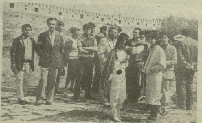
На экскурсии по Мцхета.

Теплым воскресным утром два «Икаруса», заполненные гостями, направились в древнюю столицу Грузии — Мцхета. В первую очередь автобусы, в которых здесь и там слышалась армянская, грузинская и русская речь, направились к Мцхетскому монастырю Джвари. С большим интересом осматривали представители одной из дре-