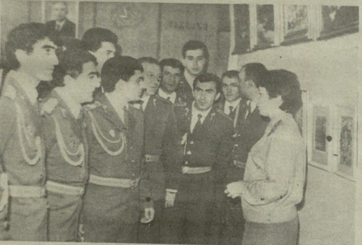
Во время осмотра выставки работ самодеятельных художников МВД ГССР.

Вечером, покидая столицу Грузии, гости из Армении поделились своими впечатлениями от визита, оставив следующие записи в наших блокнотах: