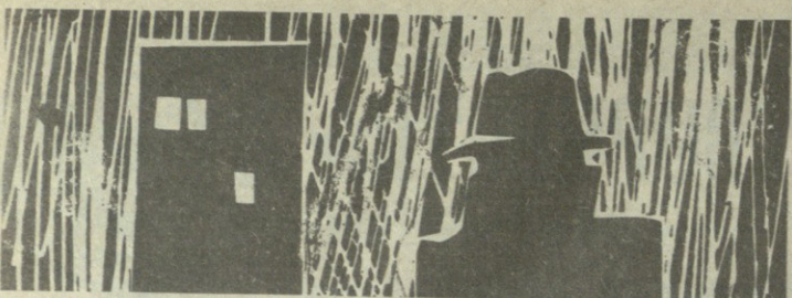
ზაალ მესხინაძე რეჟისორი