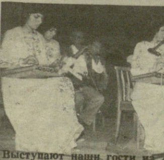
Выступают наши гости из Армении.