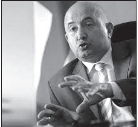
არჩევნების თემა დაიხურა ამით და 2024 წლამდე უნდა ვუყუროთ „ოცნებას“?

– ამ ეტაპზე დაიხურა. შარლ მიშელის დოკუმენტიდან გამომდინარე დაიხურა. არანაირი საფუძველი, რომ „ქართულმა ოცნებამ“ შეასრულოს რალაც პირობა, არ არსებობს. მართალია „ქართული ოცნება“ ცინიკურად და უტიფრად იქცევა, მაგრამ ამომრჩეველი რატომღაც ამას ვერ ხედავს.