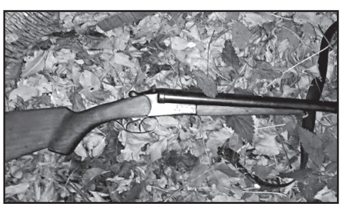
გადაყვანილი, სადაც შესაბამისი მკურნალობა უტარდება.