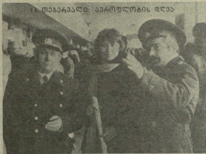
14 თებერვალს აპროფლოტის დღს

დიდი პასუხისმგებლობით გრძნობით ასრულებენ თავიანთ მოვალეობას ქ. თბილისის აეროპორტის შინაგან საქმეთა სახაზო განყოფილების მუშაკები — საზოგადოებრივი წესრიგის დაცვა, მგზავრთა უსაფრთხოება, ტრადიციული სტუმარ-მასპინძლობით საქმრო რჩევის მიცემა ჩვენი ქალაქის სტუმრებისათვის — ეს მათი უოველდღიური საქმიანობაა.