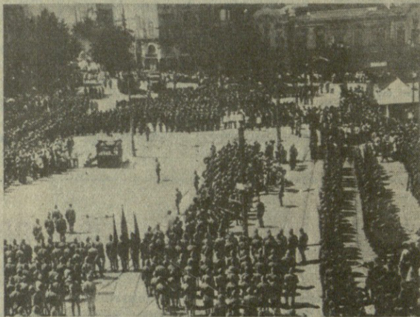
Парад XI армии в Тифлисе.

«Мы, рабочие Батуми, вышедшие из подполья и собравшиеся на первый пролетарский митинг профсоюзов, заслушав доклад о советской политике, единогласно постановили в вашем лице приветствовать Совет-