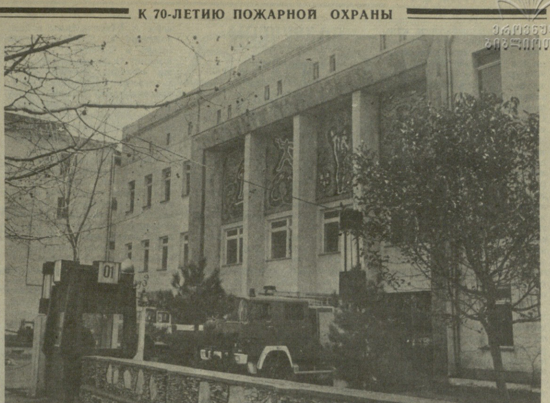
К 70-ЛЕТИЮ ПОЖАРНОЙ ОХРАНЫ

13 марта сотрудниками ЛОВД на ст. Самтрედია задержан гр. Ю. К., колхозник села Гонио Хелвачаурского района, который при попытке вывоза сельхозпродуктов за пределы республики пытался в виде взятки дать 100 рублей сотруднику милиции.