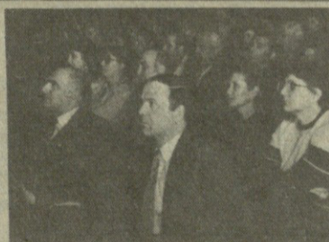
ნარკომანიის პრობლემებს შეეხო ჩვენს რესპუბლიკაში.

ყველა ეს პრობლემა თითოეული ჩვენგანის საზრუნავია და მართლაც მთელმა ჩვენმა რესპუბლიკამ ხმა აიმაღლა ამ საშინელი სოციალური ბოროტების წინააღმდეგ. ის სხდომაც, რომელიც 18 მარტს მეტროსის სახელობის კულტურის სახლში გაიმართა სწორედ