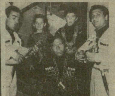
სწრაფი: გამოფენის ტ. ჯაქვაძის საჩუქარო ანსამბლი.

ფესტივალის გახსნას დაესწრო სსრ კავშირის შინაგან საქმეთა სამინისტროს პოლიტსამმართველოს უფროსი, შინაგანი სამსახურის გენერალ-ლეიტენანტი ა. ვ. ანიკივი და რესპუბლიკის შინაგან საქმეთა სამინისტროს ხელმძღვანელობა.