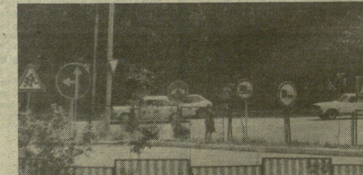
НА СНИМКАХ: 1. Вот так выглядят бывший автогородок в парке культуры и отдыха им. С. Орджоникидзе. 2. Автогородок в 99 средней школе, построенный по инициативе родителей.

жения, выставляли целые ряды около школы, у перекрестков и пешеходных переходов. Дети с удовольствием регулировали движение. Почему-то Министерство народного образования упразд-