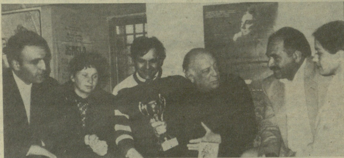
ТИАТАРის მოყვარულთა შორის დიდი მოწონებით სარგებლობს ახლად შექმნილი ვერცხო ანჯაფარიძის სახელობის ერთი მსახიობის თეატრი, რომლის სულისჩამდგმელი და მთავარი გმირია რესპუბლიკის სახალხო არტისტი კოტე მახარაძე.