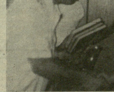
დალოვის კულტურა, რაც ჩვენდა სამწუხაროდ სათანადოდ არ გაგვიჩინა.

10. კობალაძე — პირადად თქვენ თვლით თუ არა, რომ ჩვენი დეპუტატები შედარებით პასიურობდნენ და რომ მომავალში საჭიროა მსოფლიო