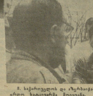
3. საქართველოს და აზერბაიჯანის სახალხო ფრონტის წევრები აქ ხართო სატყვიარმა მოიყვანა.