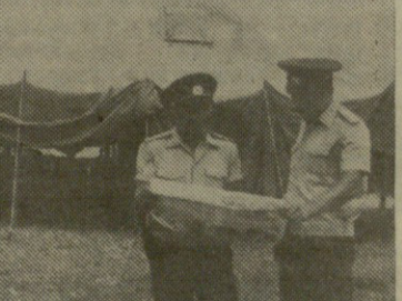
2. მორიგი შემოწმებისას.

პირობებში გვეწევს, სწორედ დღეს დილით პირველი კურსის მსმენელებმა ჩააბარეს ჩაფვლა სპეცტაქტიკა-