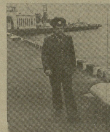
1980 წლიდან მუშაობს ბათუმის შინაგან საქმეთა რაიონულ განყოფილებაში უბნის უფროსი რეზუმიბე...