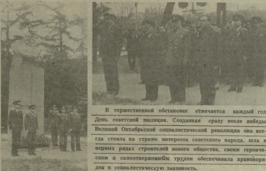
В торжественной обстановке отмечается каждый год День советской милиции. Созданная сразу после победы Великой Октябрьской социалистической революции она всегда стояла на страже интересов советского народа, шла в первых рядах строителей нового общества, своим героическим и самоотверженным трудом обеспечивала правопорядок и социалистическую законность.

სსრ კ. შალამბერიძე სსრ კ. რეხვიაშვილი სსრ კ. ბუჯიშვილი სსრ კ. ციციძე