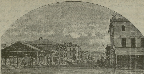
უმთავრესი ქუჩა ქალაქ ირგულტსკში (ციმბირში).

ჩრისა აღებ-მიცემობისთვის. ჩინეთმა ამაზეც უარი უთხრა ინგლისს, თუმცა ინგლისის მთავრობა ჯერ კიდევ გულს არ იტეხს. ასევე გადაუწყვეტილია ჯერ კიდევ ჩინეთის სესხის საქმე. ინგლისმა წინადადება მისცა ჩინეთის მთავრობას 12 მილიონ სტერლინს ე. ი. 120 მილიონ მანეთს მოაკემ სესხათ საუკეთესო პირობებითა. ჩინეთი ყოყმანობს: არ იცის აილოს თუ არა ინგლისიდან ვალი, რაც მას, თქმა არ უნდა, განსაკუთრებით ინგლისის გავლენას დაუმორჩილებს. ერთი სიტყვით დღეს ჩინეთს უფრო რუსეთის ეშინია, რომელიც, თავად უხტომსკის სიტყვით, ითვლება „მთელი აღმოსავლეთის სულიერ მეთაურით“.