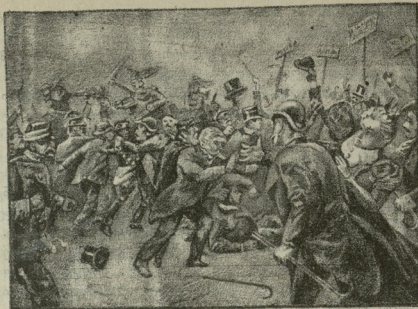
არეტულობა პარიუის ზულფარზე.

ის კობტა და ლამაზი შენობებიც საქმარისია, რომ- ლებიც ზეით მოვისხენიეთ. რისთვის ააგეს ეს სახ- ლები, რას აკეთებენ შიგ? ამას ნუ იკითხავთ, რადგა- ნაც პასუხს ვერ მიიღებთ. მართალია, ვინც ადგი- ლობრივ გაზეთებს კითხულობს, ის იქ არა ერთხელ ამოიკითხავდა ასეთ ამბებს: კავკასიის აბრეშუმის სა- კეთებელ სადღურში ეს და ეს სპეციალისტი წაიკით- ხავს ლექციას აბრეშუმის ჰიის კვებაზე, ან აბრეშუ- მის კეთების სარკებლობაზე და ამ საქმის გაუმჯობე- სებაზე და სხვა ამისთანები. მაგრამ ვის უნდა ეს, ვინ საჭიროებს ამ გვარ ლექციებში და დარჩებაში? ყვე- ლამ უწყის, რომ თვლილი ამიერ-კავკასიაში სრუ- ლებით აბრეშუმის მოყვანის ადგილი არ არის და თუ სადმე საჭიროა ასეთი ლექციები, ეს მხოლოდ იქ სადაც აბრეშუმის მოყვანას მართლა მისდევენ, ე. ი. ქუთაისის და ვანჯის გუბერნიებში. კავკასიის სააბრე- შუმო სადღურის ნასწავლ მოხელეთ კი თვლილიში მო- უყრიათ თავი და ფეხ მოკეცილი სხედან. მიიღი მა- თი მოკმედება აშკარათ გვეუბნება, რომ ამ ნასწავლ მეაბრეშუმეთ ჩინეთის სახელმწიფოზე უფრო შეტ- კივთ გული, ვინემ კავკასიაში აბრეშუმის მოყვანა- ზე. ამას გვიტკიცებს ჩვენ შუშიდან მოწერილი კო- რესპონდენცია (იხ. „ახალი მიმ.“ № 4858). კორე- სპონდენტი აღნიშნავს იმ ფაქტს, რომ აბრეშუმის მომყვანთ ზოგიანი თესლი არაოადეს არა აქვთ და არც იმედს აქვთ, რომ იზოგონ, ვინაიდან ყოველ- თვის უტყაოეთიდან მოტანილ თესლს ხმარობენ. „თქვენ შეიძლება იკითხოთო — ამბობს კორესპონ- დენტი — რას შერება სააბრეშუმო სადღური თფი- ლისში თავისი განყოფილებით, შუშაში და ნუხაში ის სადღური, რომლის განკარგულებას ქვეშ იმყო-