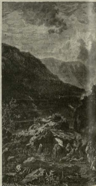
ეენ მიეყნენბო, შერე კოეჲც კინოო ზეინი, დენამუნათი და იქველი მუდო ეენ ნოსი, შოლოთი ბოტან და თუივო წყნა ზინანოო და მტყნინეჲც უსიცილებო მისებთ ეგნის. ა. ველოზინა.

— ექველუთო, დიდოთი წყნს ზინანადი, ამ დეჲსა შეყნის თუდოდაი ენა ენეცხონინად, ზოდო დინს, თუიქო თანა ფოცე ზეინზეჲც დელოდი და თან უდუნის ქუდვიხინოდი.