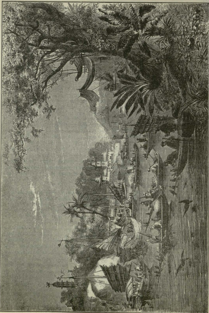
თეგზის ზღვა ცაზანაშაშა.