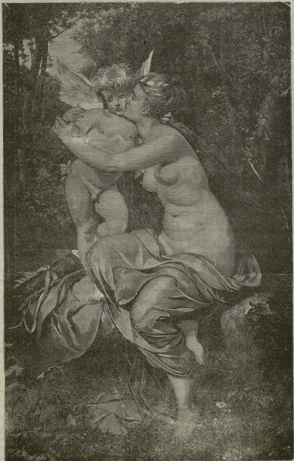
კუპიდაონი და პსიქე.