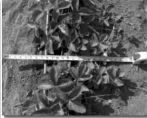
სურათი 17. ივნისში მსხმოიარე ქისპირველ ჯრდპირველ ველს, სერულ რიგში.