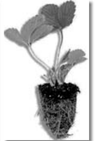
suraTi 13. mTvl emare "frigo" nergi (marcxniv), axal i foTI ovani nergi (SuaSi) da "pl ug" nergi (marj vni v).

adgil ebSi gvi an Semodgomaze mcnareebi, rogorc wesi, unda dai faros Cal iT an namj iT, raTa Tavidan avicil oT zamTarSi moyinv iT gamowveul i dazianeba. Cal a, namj a unda moixsnas adreul gazafxul ze da marwyvi ayvavil deba maisSi, msxmoiaroba ki, Cveul ebriv, iwyeba ivni sis dasawyisSi, Ri agruntis SemTxvevaSi, da gagrZel deba mTel i zafxul is da momdevno wl is Semodgomis ganmavl obaSi dRis xangrZl ivobisadmi neitral uri jiSebisTvis.