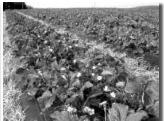
suraTi 16. marwyvis moyvana orri gi an SemaRl ebul kval ze.