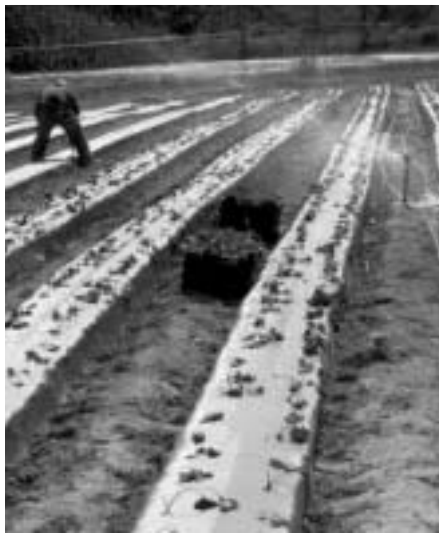
suraTi 14. nakveTis saTanadod Camoyal i bebi sTvis saWiroa marwyvis gadargvisTanave morwyva.

Zal ian mniSvnel ovania sertificirebul i, j ansaRi nergebis SeZena sando sanergedan. marwyvis