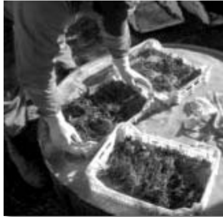
suraTi 15. marwyvis varj is da fesy-Ta sistemis fungicid i T Sewamvl a Car-gvamde.

erT-erTi yvel aze seriozul i sokovani daavadebaa anTraqnozi anu varj is sidampl e, romel sac SeuZl ia swrafad gaanadguos erTi Sexedvi Tj ansaRi mcenareebi. daavadeba SeiWreba j iSebis umetesobis varj ze, foTl ebze, ZirSi, yvavil ebsa da nayofze. anTraqnozi SeiZl eba gavrcel des rogorc niadagidan, aseve inficirebul i sanerge masal i dan. marwyvis mwar-moebl ebi, roml ebi c Tavad amravl eben nergebs, dganan inficirebul i sanerge masal is dargvis riskis winaSe, romel ic sabol ood dai-Rupeba. ucxouri sanergeebi dan miRebul i nergebi unda iyos ser-