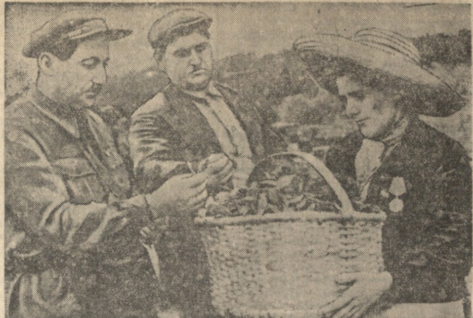
მხარობის რაიონის მარცხენა, სოფელ გურაბის ფ. მანაძის სახელობის...