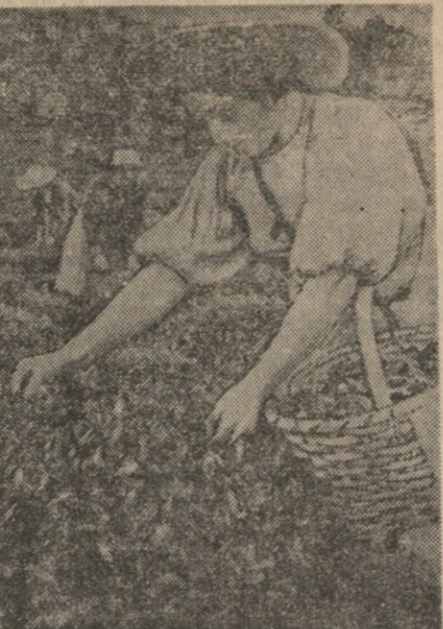
კომუნისტების თავმჯდომარე ა. მალაზა...